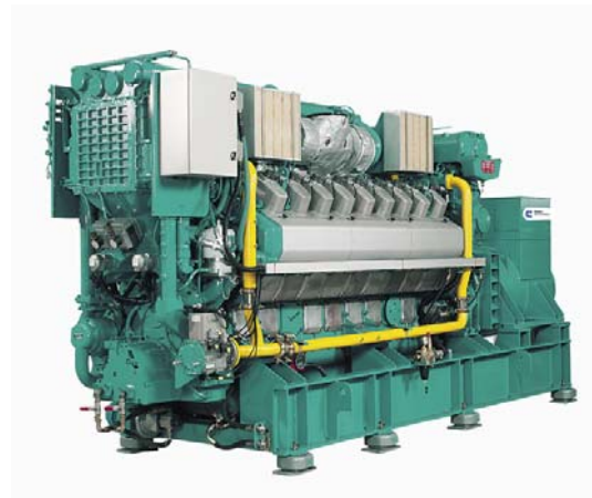
此图片包括一些非标选项